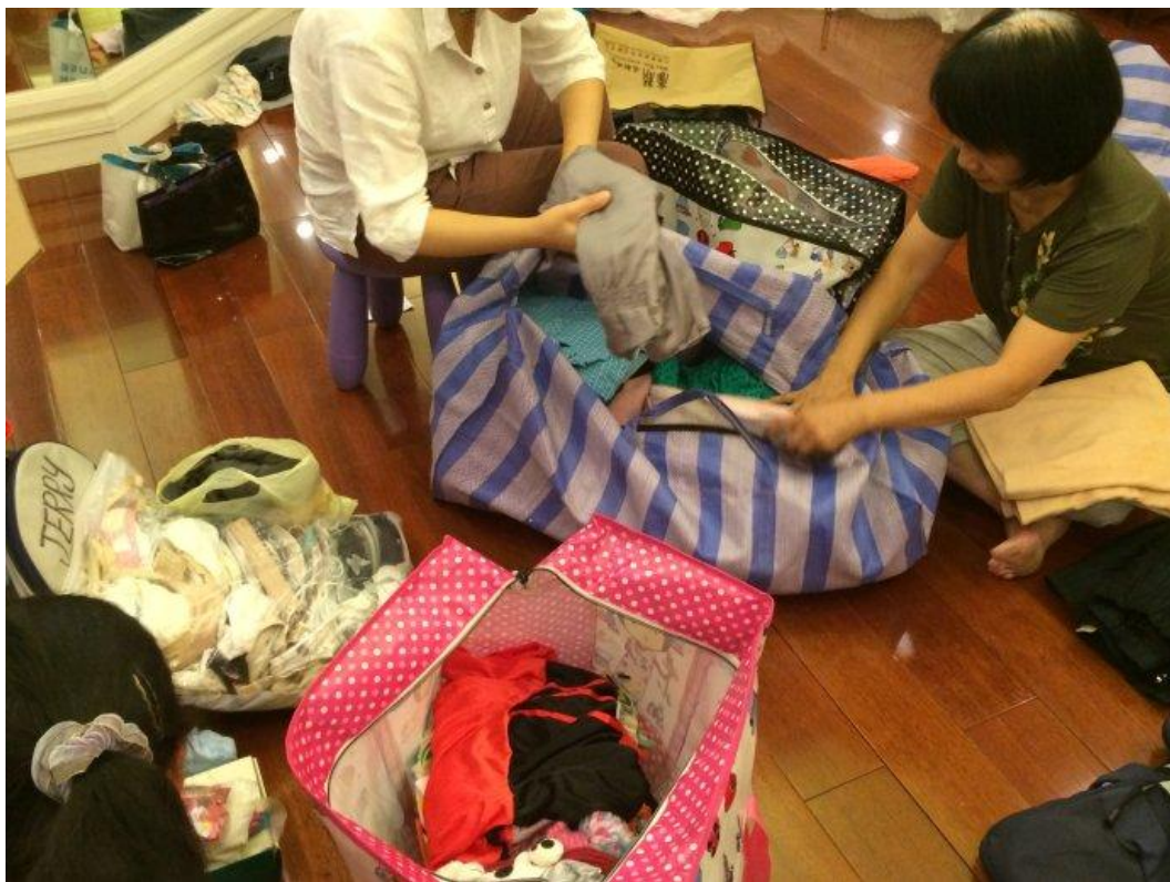
志愿者细心分类及折叠各种衣物并在袋外明确标示内容物及适用年龄,严谨的前置作业有助于发放时的效率及符合受赠者的需求。