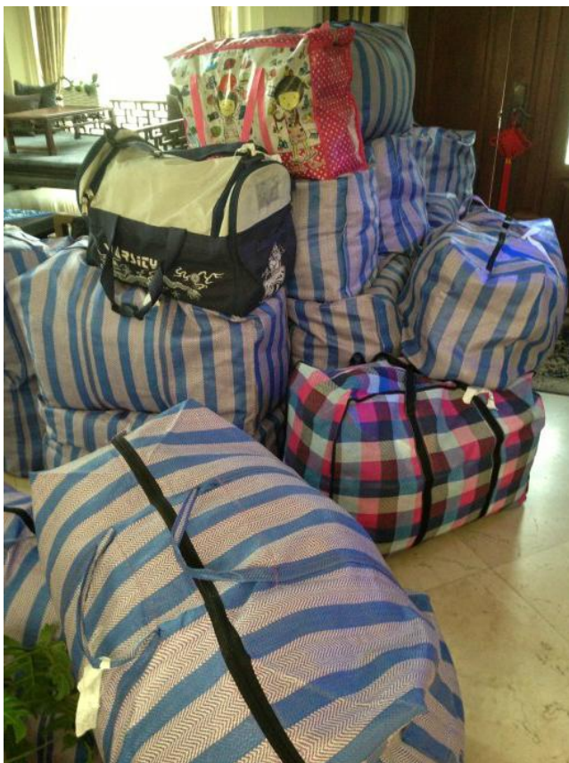
完成装袋的所有物资