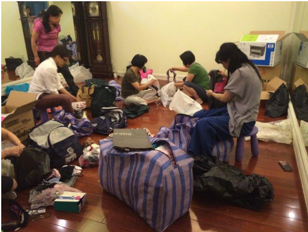
经过志愿者数小时辛苦地分类装袋已完成大部分整理工作