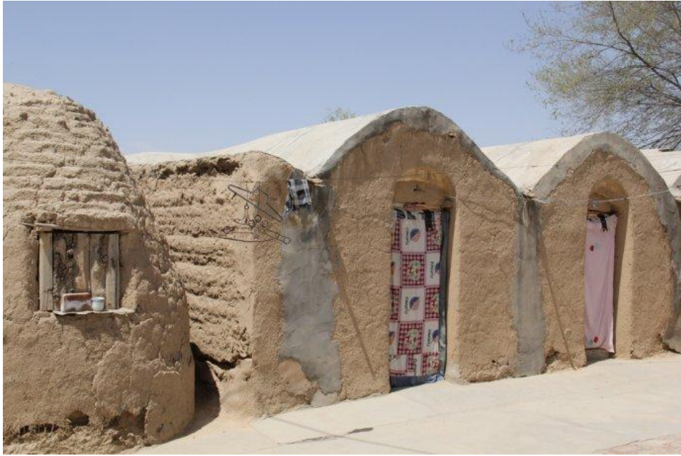
当地拮据的住房条